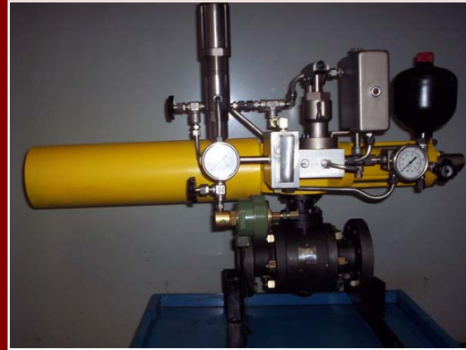
Sistemas de Seguridad de Superficie para protección de tuberías de Conducción e instalaciones de Separación ó Almacenaje