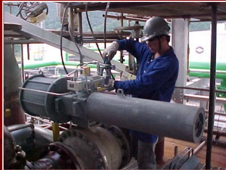
Puesta en marcha y Servicio de campo