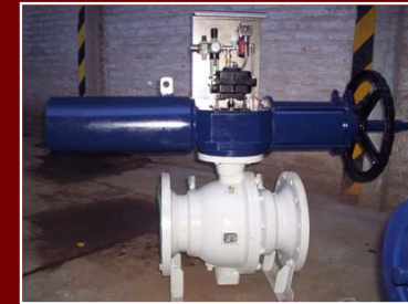
Actuadores Neumáticos de Simple Efecto con retorno a Resorte y Accionamiento de Emergencia