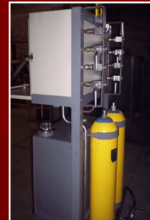
Paneles Neumáticos e Hidráulicos para Operación de Válvulas y Actuadores