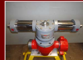
Actuadores Hidráulicos (Rack and Pinion) de Simple y Doble Efecto para Válvulas de Alta Presión